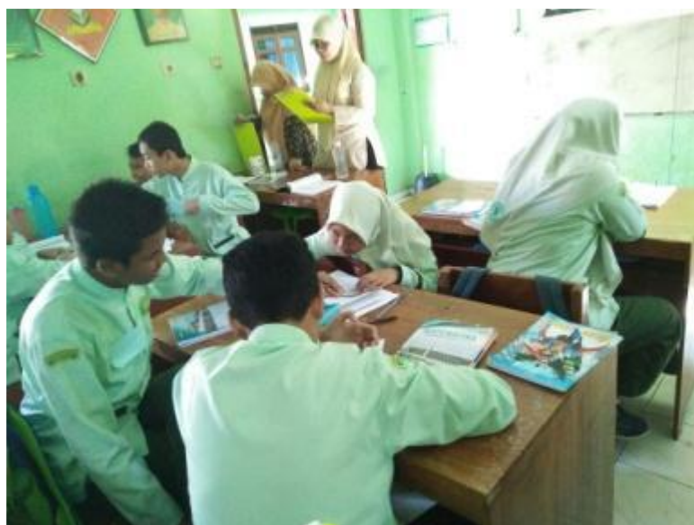
Gambar 7. Kegiatan see pada lesson study

Rencana kegiatan pendampingan dilaksanakan 3 putaran pada tiap kelompok, namun karena keterbatasan waktu maka hanya pada kelompok 3 saja rencana itu dapat dilakukan. Kegiatan pada kelompok pertama mencakup SMP Muhammadiyah di daerah Bantul kota. Pada kelompok ini kegiatan pendampingan dilaksanakan satu kali putaran. Guru model yang sudah ditunjuk, melaksanakan praktik di kelas. Sedangkan peserta yang lain melakukan observasi kegiatan pembelajaran. Kegiatan observasi difokuskan pada aktivitas peserta didik. Kegiatan yang dilakukan pada tahap ini tidak hanya do saja, tetapi juga melakukan see untuk mengevaluasi kegiatan pembelajaran yang berlangsung, seperti yang terlihat pada gambar 6 dan 7.