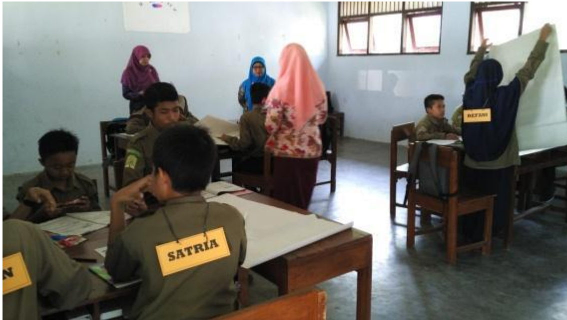
Gambar 8. Kegiatan pembelajaran di kelas.

Kelompok terakhir (kelompok ketiga) yang melakukan kegiatan pendampingan merupakan kelompok sekolah di daerah Bantul bagian timur. Kegiatan pendampingan pada kelompok ini berjalan dengan lancar. Kegiatan pendampingan dilaksanakan sebanyak 3 kali. Kegiatan plan , do dan see dapat dilakukan secara runut pada kelompok ini. Seperti disajikan pada Gambar 9 dan Gambar 10. Sesuai dengan salah satu tujuan kegiatan lesson study terkait perbaikan proses pembelajaran, maka kegiatan pendampingan lesson study pada kelompok 3 ini menunjukkan adanya perbaikan pada proses pembelajaran. Ketika kegiatan do , observer dapat melakukan observasi dengan sungguh-sungguh. Observer mendeskripsikan kondisi pada masing-masing kelompok yang diamati. Berdasarkan hasil pengamatan tersebut, kemudian akan ditarik kesimpulan terkait proses pembelajaran. Evaluasi pada proses pembelajaran menjadi pertimbangan dalam penyusunan plan untuk tahap berikutnya. Hal ini mengarahkan kegiatan pembelajaran yang dilakukan pada pertemuan berikutnya dapat berjalan lebih baik. Siswa berpartisipasi baik di dalam kelompok masing-masing atau di dalam kelas.