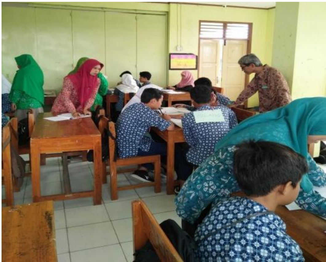
Gambar 9. Kegiatan do pada lesson study