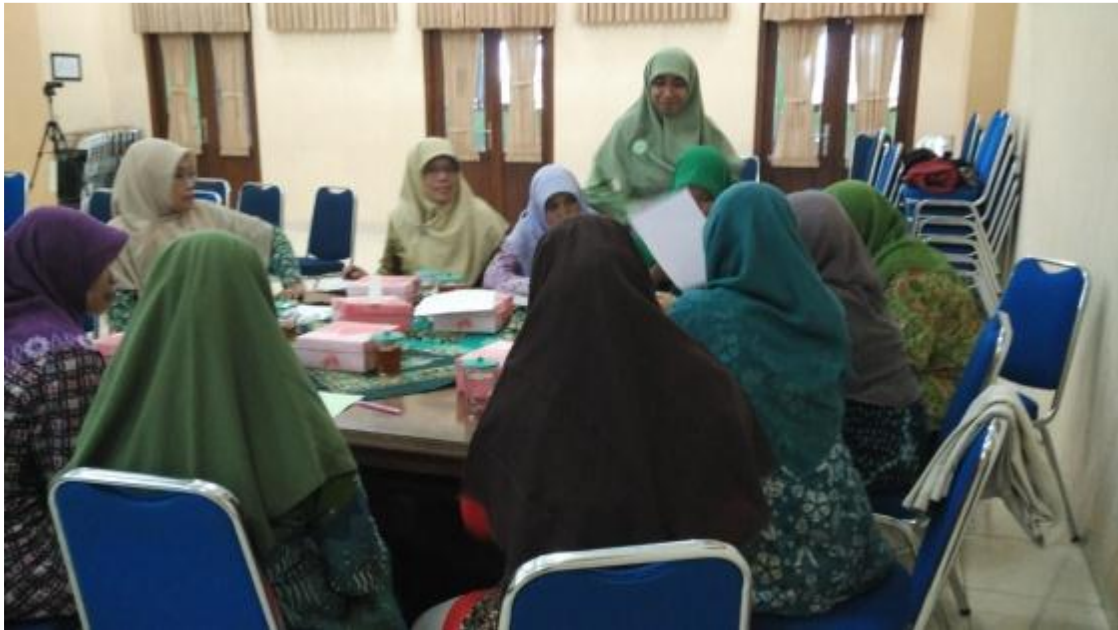
Gambar 5. Workshop penyusunan rencana pendampingan