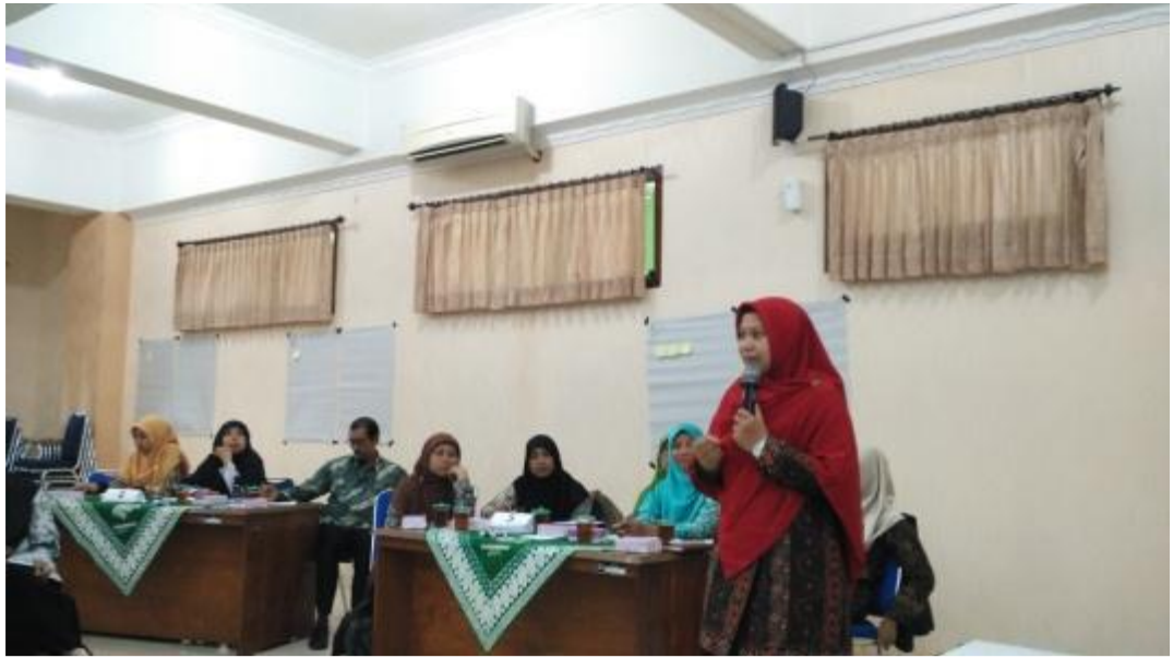
Gambar 2. Pemaparan materi pengantar diskusi

Tahap berikutnya, peserta dibagi menjadi 6 kelompok yang beranggotakan 5 – 6 orang. Peserta berdiskusi dikelompoknya tentang pengertian lesson study , aktivitas apa saja yang dilakukan pada tiap tahapannya ( plan , do , dan see ) serta peran masing-masing komponen-komponen lesson study (kepala sekolah, guru model, observer). Kegiatan diskusi ini diikuti dengan antusias. Berikut disajikan dokumentasi kegiatan diskusi kelompok.