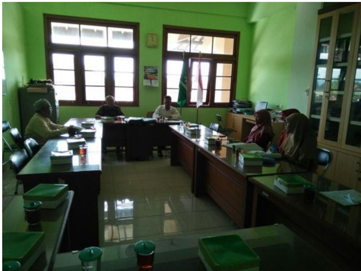
Gambar 1 Koordinasi Persiapan Pelaksanaan PPM dengan Majelis Dikdasmen PDM Bantul

Pimpinan Daerah Muhammadiyah Kabupaten Bantul; dan workshop penyusunan modul pelatihan tentang lesson study .