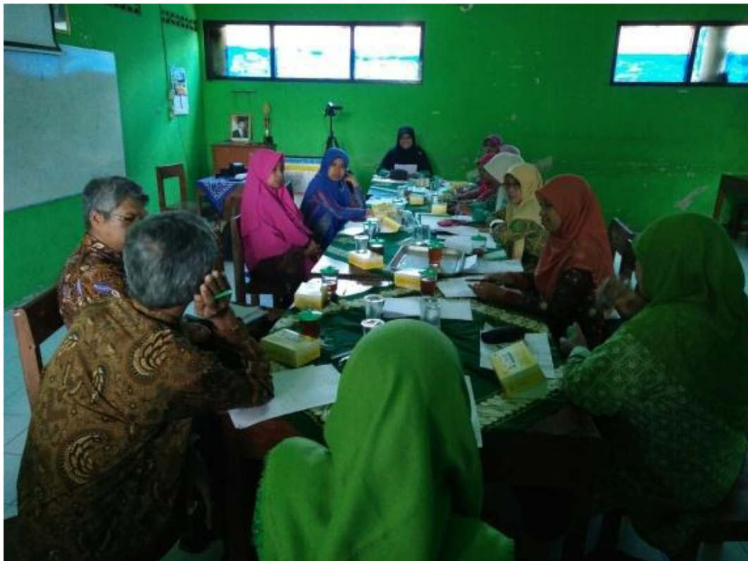
Gambar 10. Kegiatan see dan plan lesson study