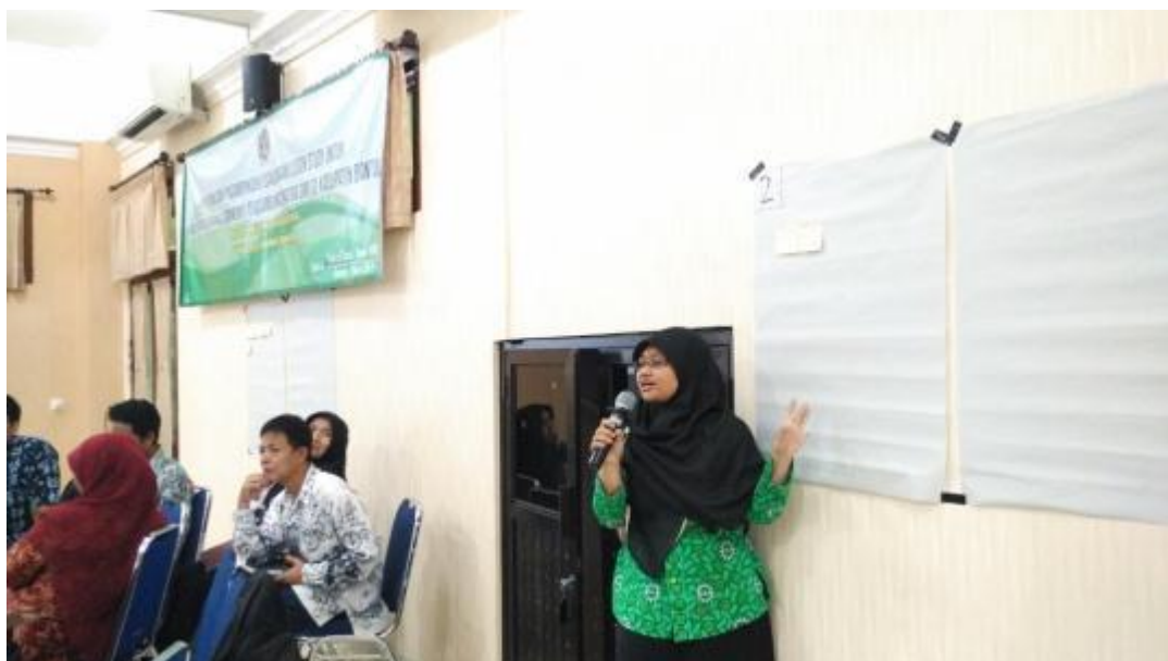
Gambar 4. Presentasi perwakilan kelompok.

Perwakilan kelompok mempresentasikan hasil diskusi kelompok mereka kepada seluruh peserta. Kegiatan ini bertujuan untuk menyamakan persepsi seluruh peserta tentang materi. Berikut ditunjukkan dokumentasi kegiatan presentasi dari perwakilan kelompok. Kemudian diskusi klasikal dan pematapan materi oleh pemateri. Sesi selanjutnya yaitu pemutaran video pelaksanaan lesson study dari sekolah di Indonesia dan di Jepang. Peserta berdiskusi secara dalam kelompok tentang hasil pengamatan dari video yang ditayangkan.