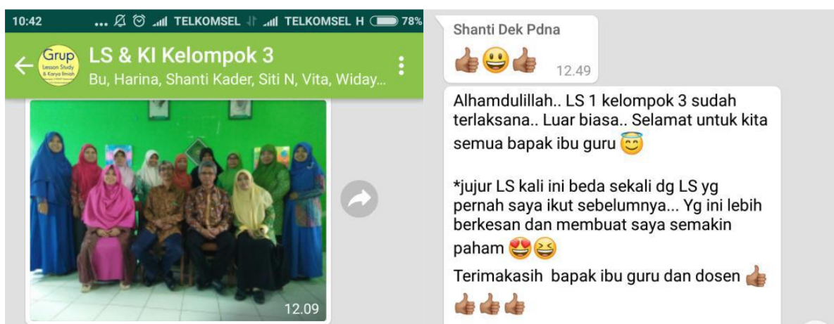
Gambar 11. Testimoni peserta pelatihan dan pendampingan

Antusiasme para guru matematika SMP/MTs Bantul atas pelaksanaan pengabdian kepada masyarakat dengan topik lesson study ini sangat baik. Hal ini bisa dilihat dari kehadiran peserta selama pelaksanaan pelatihan maupun pendampingan yang mencapai 75%. Selain itu antusiasme yang sangat baik juga dapat disimpulkan dari pengakuan peserta di grup whatsapp sebagaimana pada gambar 11.