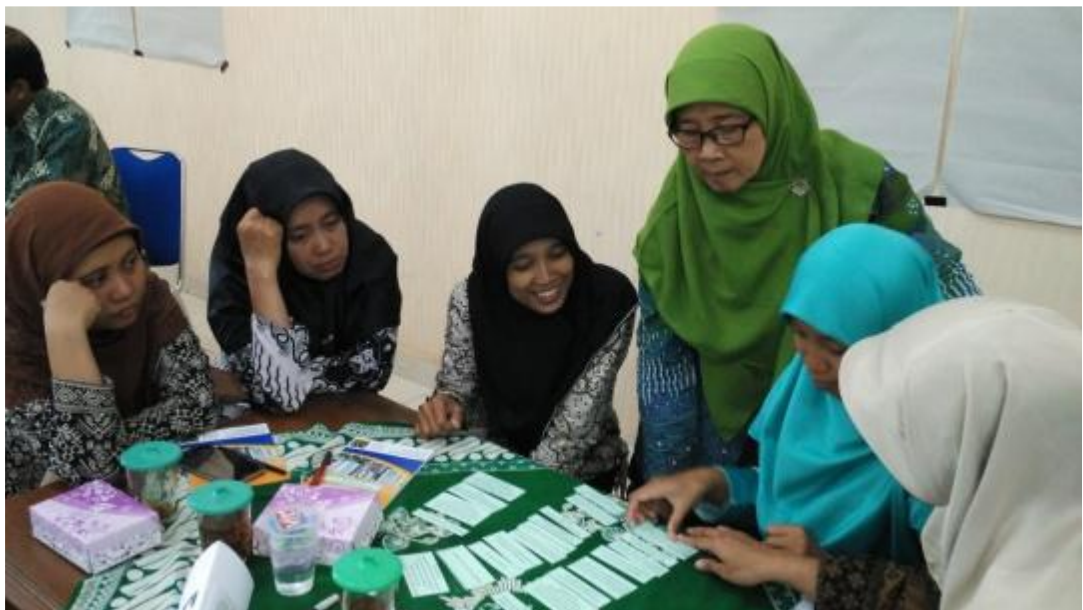
Gambar 3. Diskusi kelompok

Tahap berikutnya, peserta dibagi menjadi 6 kelompok yang beranggotakan 5 – 6 orang. Peserta berdiskusi dikelompoknya tentang pengertian lesson study , aktivitas apa saja yang dilakukan pada tiap tahapannya ( plan , do , dan see ) serta peran masing-masing komponen-komponen lesson study (kepala sekolah, guru model, observer). Kegiatan diskusi ini diikuti dengan antusias. Berikut disajikan dokumentasi kegiatan diskusi kelompok.